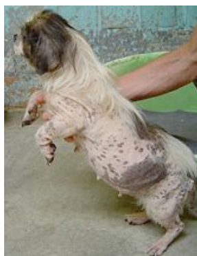
Een Shih-Tsu - fokteefje

Wanneer we enkel nog maar kijken naar de fysieke toestand waarin deze dieren verkeren, kunnen we duidelijk stellen dat welzijn voor deze dieren ernstig met de voeten getreden wordt. De honden zijn sterk verwaarloosd, hebben zo goed als geen vacht, zijn vaak erg mager met vaak ernstige wormbesmettingen en worden niet gehouden naar de normen van dierenwelzijn.