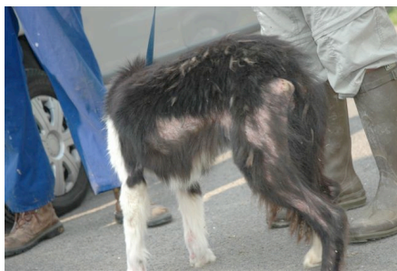
Een border collie – fokteefje

Dit zijn enkele honden die uit een Belgische, erkende fokkerij komen: